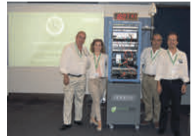
Evento MIFID II-Madrid 3/10/17

En la parte que nosotros cubrimos, la sincronización de tiempo, es importante identificar aquellos servicios que deben cumplir con MIFID II en que rango de resolución y exactitud deben estar y dotar a la infraestructura de IT implicada de los elementos de monitorización necesarios.