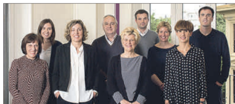
Equipo profesional de KNC Kemen Consulting

Por su parte, una de las principales novedades del Reglamento General de Protección de Datos que entrará en vigor el próximo año es la figura del Delegado de Protección de Datos (DPO). El nuevo Reglamento establece un estatus jurídico propio para el DPO, concede ciertas garantías frente al despido y regula su papel y su relación con la empresa. Frente a este